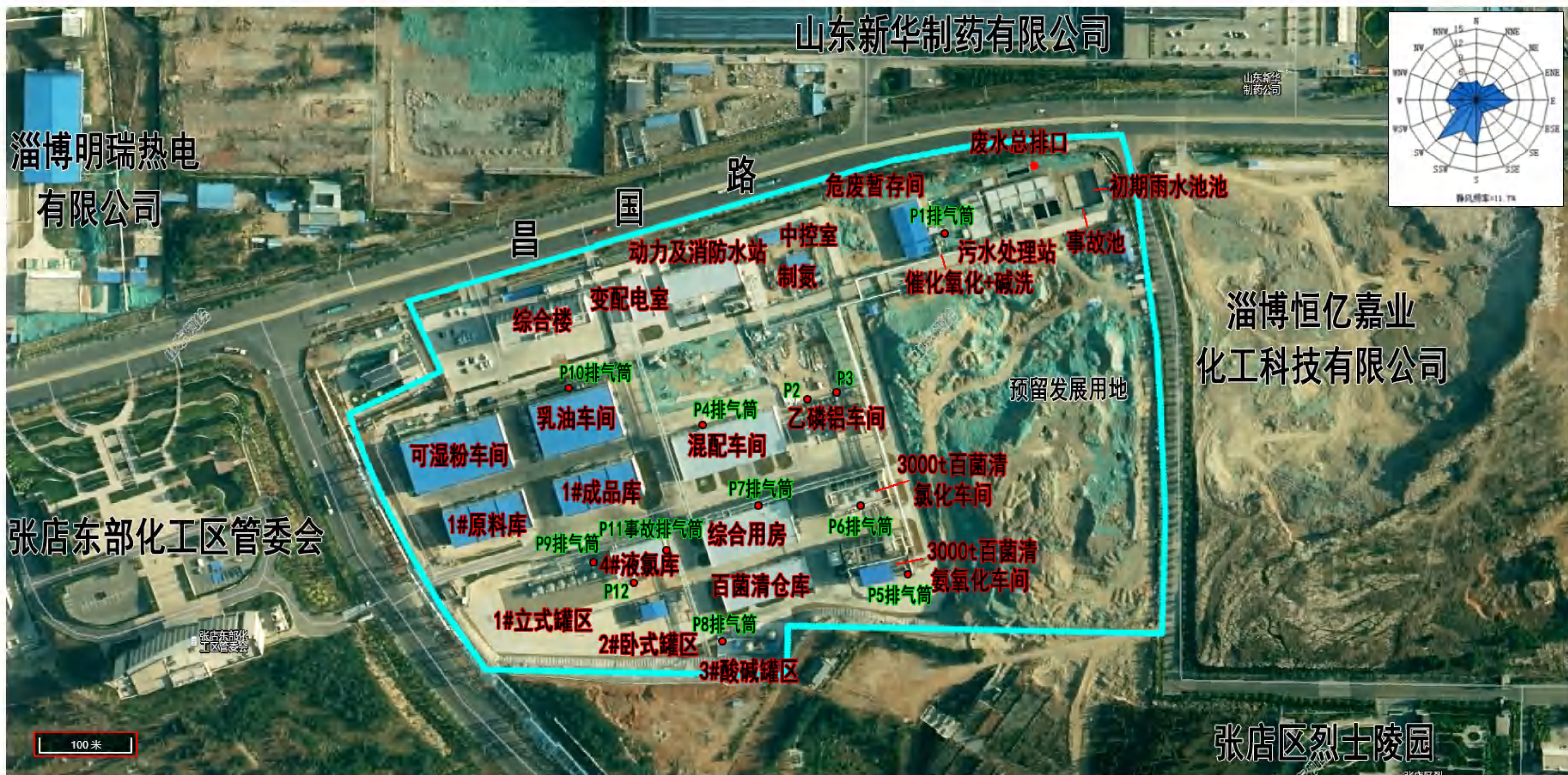
图2.2-4 厂区现有及在建工程平面布置图