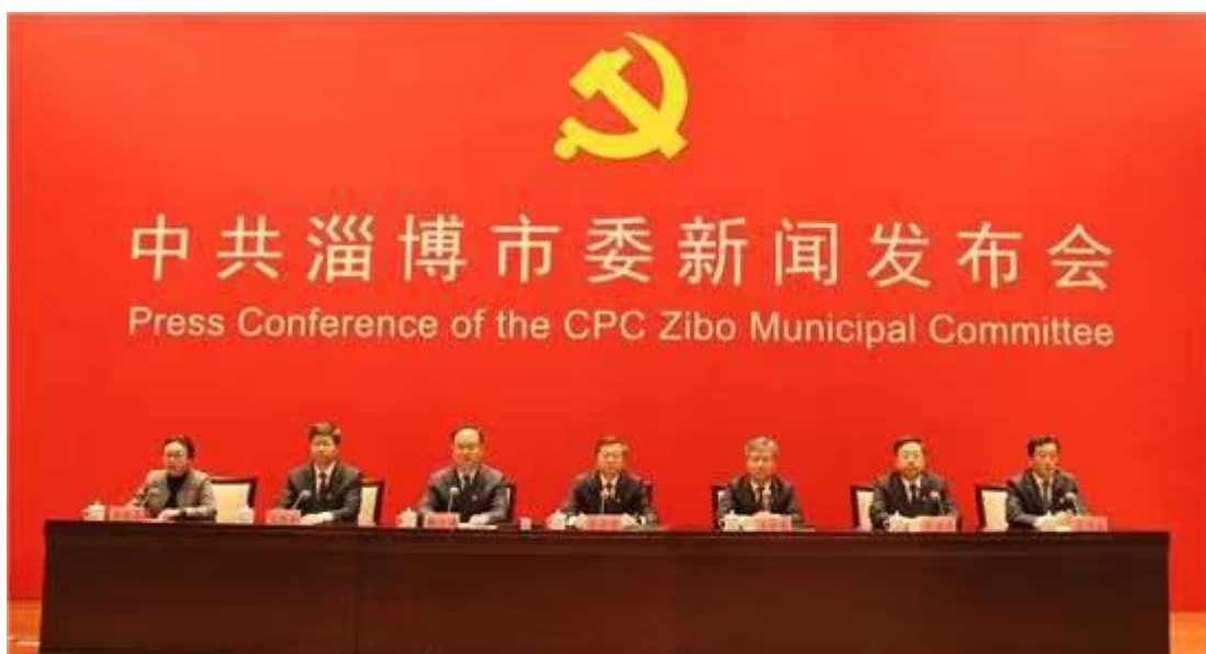
2021年通过市政府网站主动发布各类政府信息